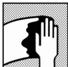
Dynacoat Uni Degreaser